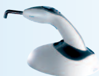
bluephase: lámpara de polimerización LED de alto rendimiento.

Dental Advisor, un asesor renombrado de productos dentales con sede en USA, han concedido la clasificación de "Top Product 2010" a bluephase y VivaPen en sus respectivas categorías. La lámpara de polimerización LED inalámbrica de alto rendimiento y el innovador sistema de dispensación han ganado por lo tanto este galardón dos veces seguidas.