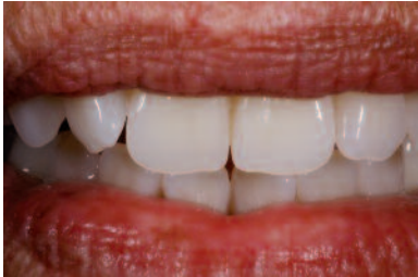
Suave integración de prótesis removibles con SR PHONARES® NHC.

No hace mucho tiempo, las prótesis removibles se identificaban claramente en boca. La introducción de SR Phonares, ha transformado las prótesis identificables, en un hecho del pasado.