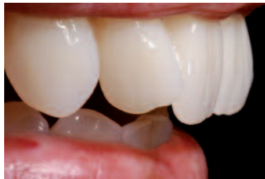
Incluso los dientes posteriores tienen un aspecto natural como resultado del diseño "Set&Fit".

Los dientes posteriores SR Phonares, funcionales, complementan idealmente dichos dientes anteriores. SR Phonares Typ NHC es un diente protético clásico, que está indicado para una amplia gama de indicaciones. Se basa en el reconocido principio "Typ". SR Phonares Lingual NHC se utiliza principalmente en prótesis sobre implantes en las que la distribución lingualizada de la fuerza, es de máxima importancia.