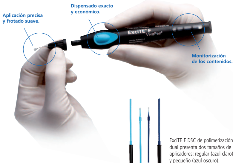
ExcITE F DSC de polimerización dual presenta dos tamaños de aplicadores: regular (azul claro) y pequeño (azul oscuro).

ExcITE F DSC está disponible en higiénicas unidades monodosis de dos tamaños diferentes: regular para preparaciones normales y Small para microcavidades y conductos radiculares.